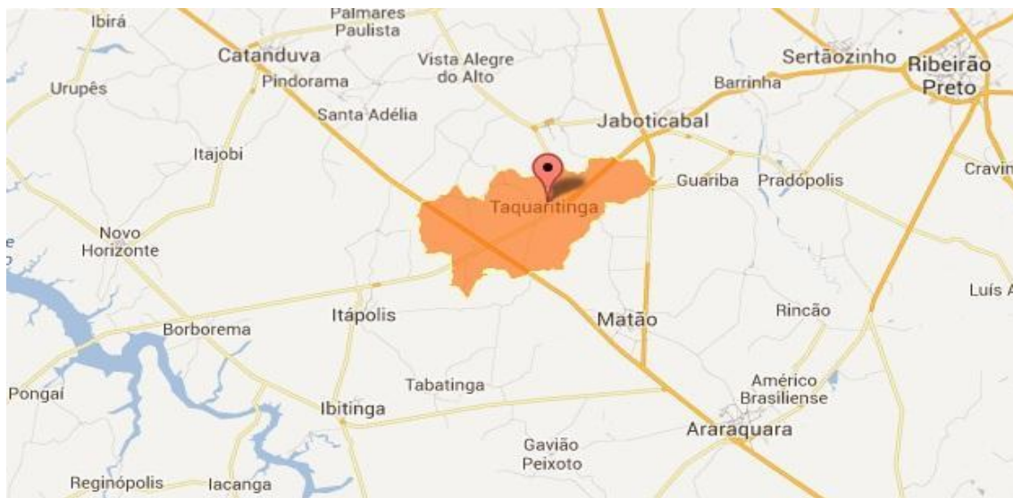
Figura 1 – Mapa (Município de Taquaritinga, SP)